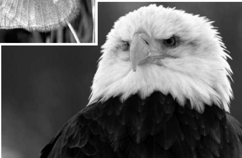
Pygargue à tête blanche