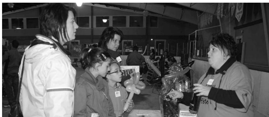
Les parents ont pu visiter différents kiosques d'information portant sur la promotion de la santé et tout ce qui touche le mieux-être.