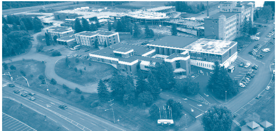
Cette photo aérienne montre les édifices de l'Université de Moncton, campus d'Edmundston, le nouveau CCNB - Edmundston et la polyvalente Cité des Jeunes A.-M.-Sormany, à l'arrière. On a droit ici à un véritable Centre du savoir!

C' est le 7 juillet 2009 que les premiers travaux de construction du nouvel édifice du Collège communautaire du Nouveau-Brunswick - Campus d'Edmundston ont débuté. En septembre 2011, les étudiantes et étudiants de la cohorte 2011 ont été accueillis sur le « nouveau campus » et ils profitent amplement des nombreux avantages. C'est un bâtiment dont l'architecture a été pensée en fonction des besoins de la clientèle étudiante.