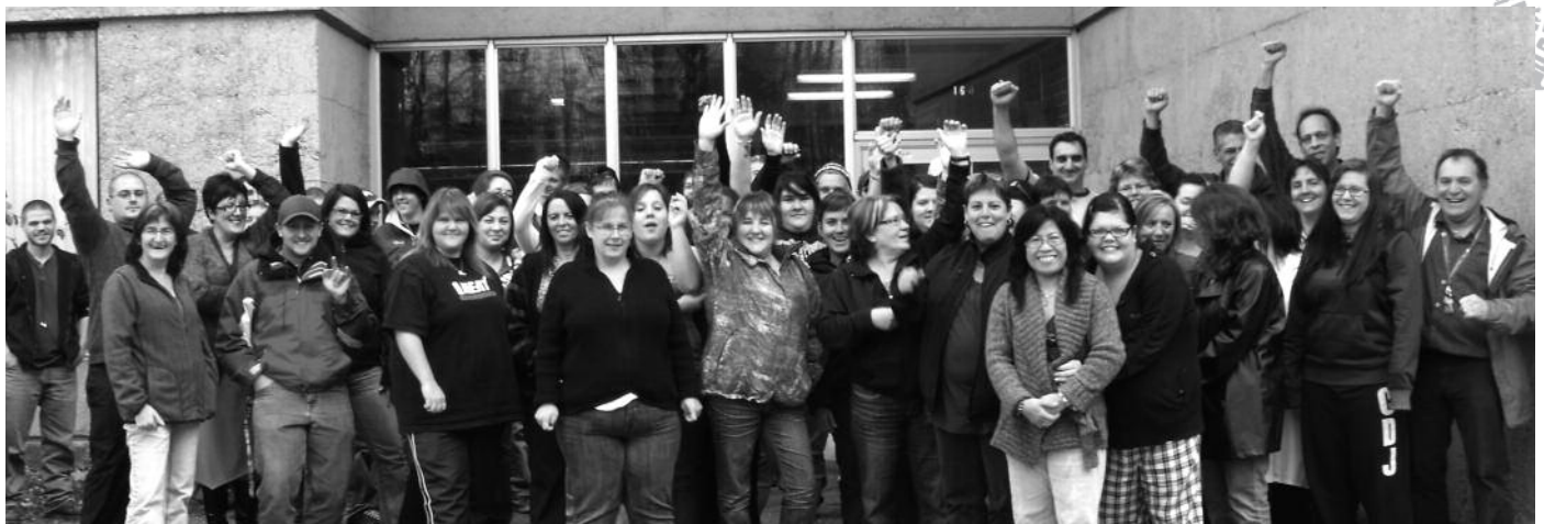
Comme on peut le constater, la bonne humeur était au rendez-vous chez les participants.

Joignez les rangs d'un RÉSEAU DYNAMIQUE! Faites connaître vos HISTOIRES À SUCCÈS!