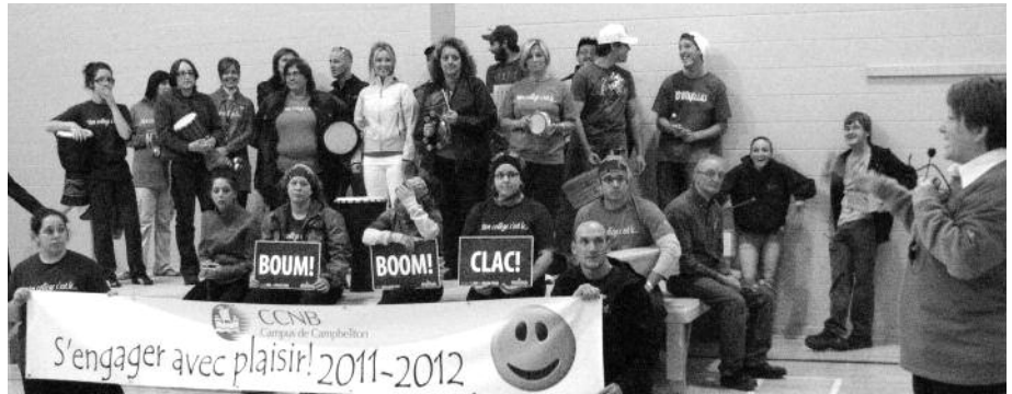
S'engager avec plaisir ! 2011-2012 ; voilà une banderole qui en dit long sur la volonté de l'établissement à promouvoir le mieux-être.