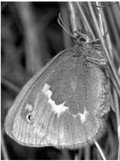
Satyre fauve des Maritimes