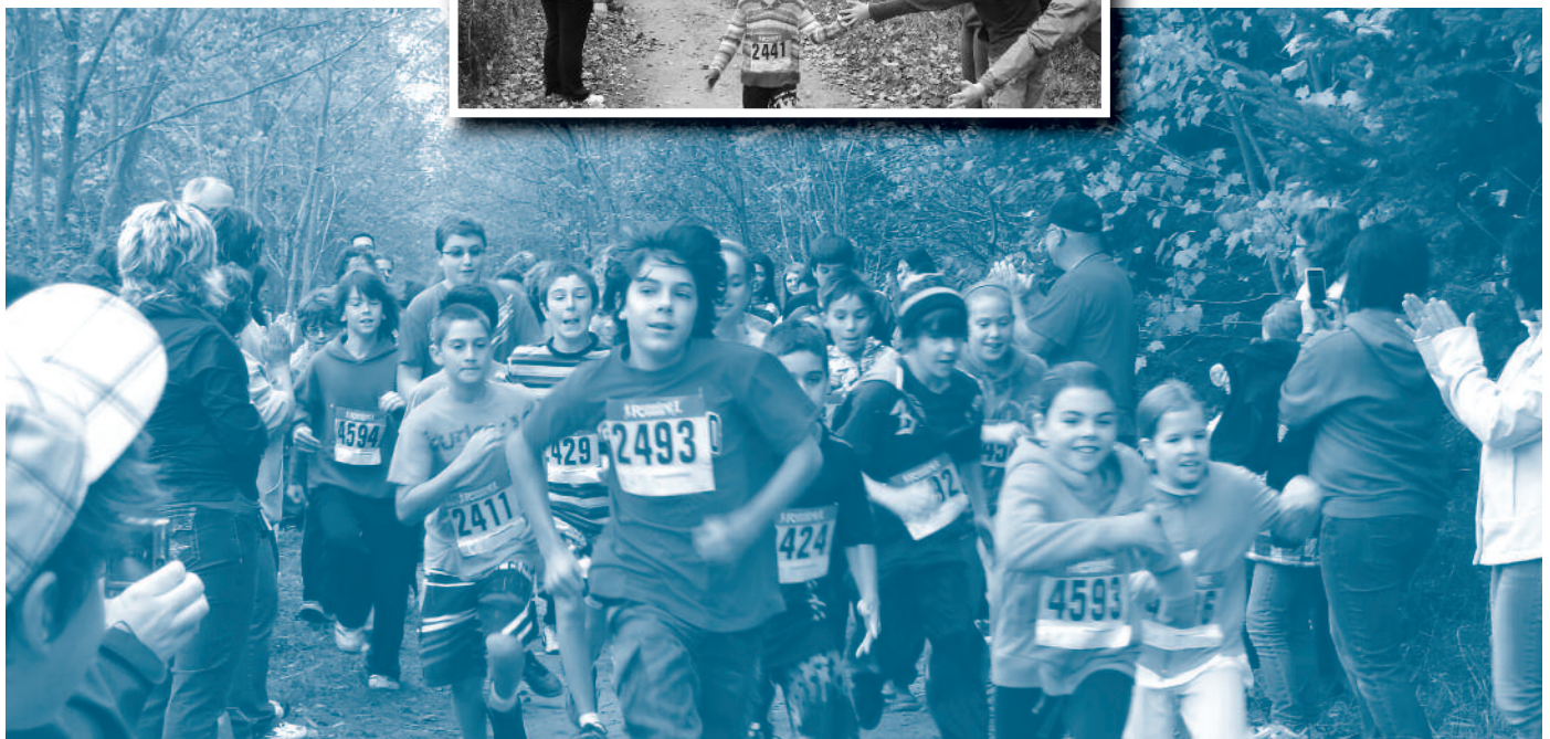
Ces photos prises lors de la Course Ola-Santé illustrent bien le sérieux, la détermination et le courage des élèves. Bravo!