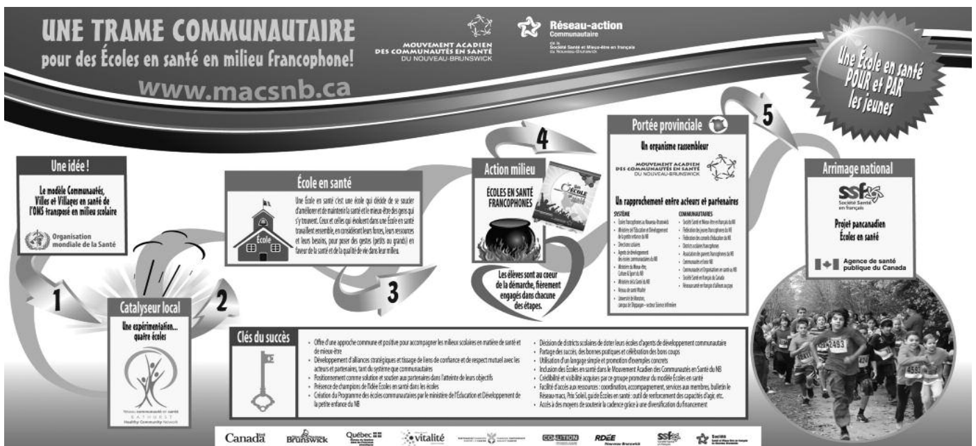
Les délégués présents aux deux rencontres ont eu l'occasion d'en connaître davantage sur la démarche des Écoles en santé au N.-B. grâce à cette magnifique bannière.