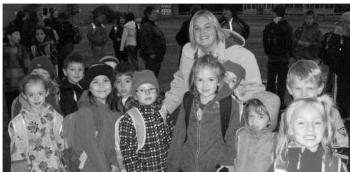
Allez, les élèves... on marche tous ensemble en direction de l'école. Quelle belle initiative!

Au début octobre, l'établissement a participé à la journée Marchons vers l'école. Cela incluait également les élèves qui sont de la municipalité et qui marchent habituellement.