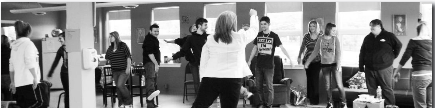
Visiblement, les étudiants ont beaucoup de plaisir à pratiquer les mouvements associés au Brain Gym.