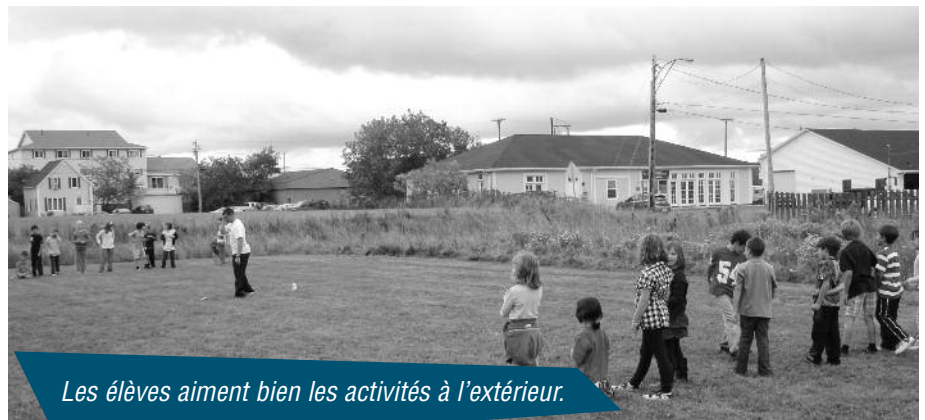
Les élèves aiment bien les activités à l'extérieur.