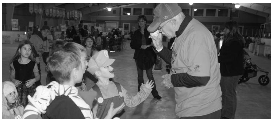
Ce bon monsieur explique aux jeunes enfants comment manier en toute sécurité une balle de baseball.

Le comité organisateur a proposé une programmation variée afin de plaire aux goûts de tous et chacun. Ballons artistiques, maquillage, kiosques mieux-être, atelier sur la façon d'installer un siège d'auto pour enfants offert par le Centre de Ressources Familiales (CRFPA), le coin photos, rallye d'observation (fait par les jeunes du CAJ de Saint-Isidore) et exercices pour adultes sont autant de raisons qui expliquent le succès de cette journée.