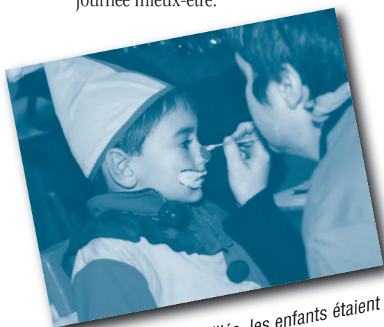
Costumés et maquillés, les enfants étaient tout simplement adorables.