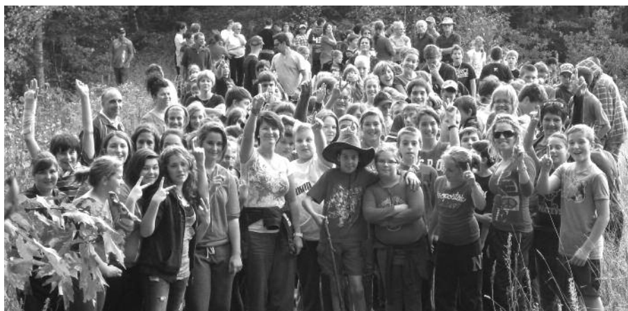
Visiblement, tous les participants (élèves - personnel et - parents) ont fort apprécié cette activité en plein air.