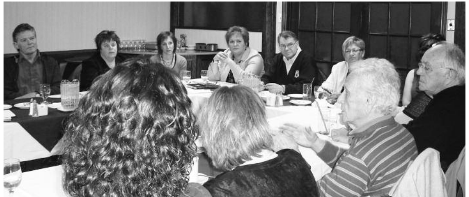
Après le Nord-Ouest (photo), le MACS-NB est allé rencontrer les membres de la région Chaleur. Une rencontre qualifiée d'enrichissante et de constructive par les deux parties.

régions qui ne nous auraient pas encore reçus à nous inviter pour une visite. Ce sera un plaisir d'aller vous rencontrer sur votre terrain.