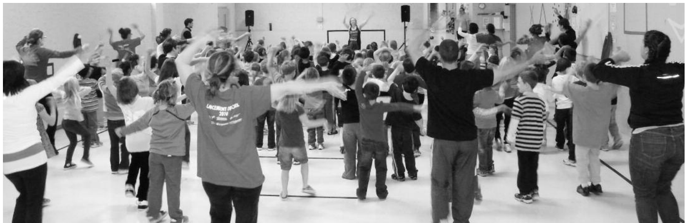
Lors du lancement de la programmation En Mouvement, les élèves ont eu la chance de faire de la zumba pendant une vingtaine de minutes.